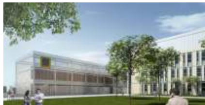
Hallen für Pilotanlagen (Visualisierung)

Bauherr des Forschungszentrums in Oran, der zweitgrößten Stadt in Algerien, ist die staatliche Erdöl- und Erdgasgesellschaft „Sonatrach Aval“, das größte Unternehmen seiner Art in Afrika.